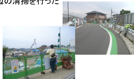
現場周辺の清掃・地域住民との交流